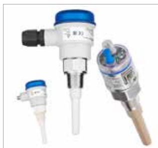
CN 7120/21 Compacto

Compruebe las increíbles nuevas características y la gama de nuevos modelos.