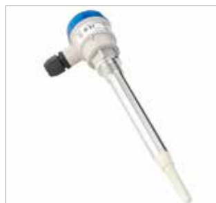
CN 7130 Tubo