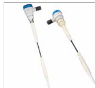
CN 7150 Cable